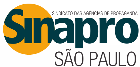
Tabela de Contribuição Sindical Patronal 2015